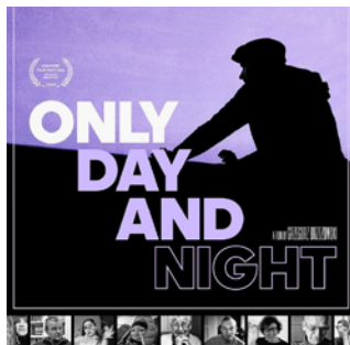
Tylko dzień i noc reż. Grzegorz Brzozowski / Polska 2024 / 69 min

POKAZ: 10.10.2024 / 18:00 Muzeum Polskiej Piosenki