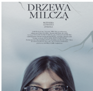
Drzewa milczą reż. Agnieszka Zwiefka / Polska, Niemcy, Dania 2024 / 84 min

POKAZ: 09.10.2024 / 19:00 Miejska Biblioteka Publiczna