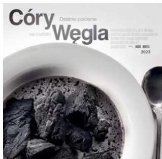
Córy węgla reż. Aneta Nowicka / Polska 2023 / 68 min

Dwudziestoparoletnia Oliwia wyrusza w podróż do piekła. Kultuwując górnicze tradycje rodzinne, za namową matki zatrudnia się w sortowni, należącej do jednej ze śląskich kopalni.