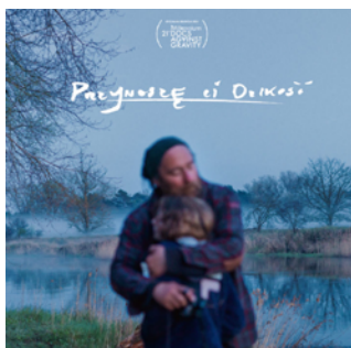
Przyniosz ci dzikość reż. Dyba Lach / Polska 2024 / 69 min

POKAZ: 06.10.2024 / 19:00 / NCPP 12.10.2024 / 18:00 / Kino Meduza