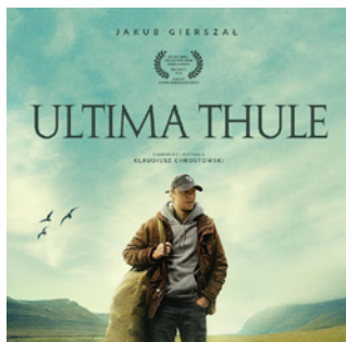
Ultima Thule reż. Klaudiusz Chrostowski / Polska 2024 / 79 min

POKAZ: 04.10.2024 / 20:00 Kino Helios CH Solaris