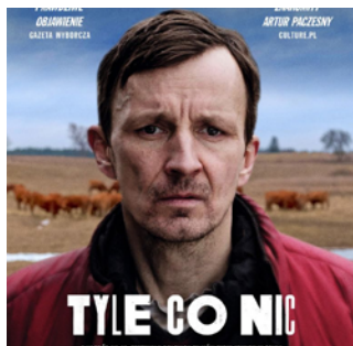
Tyle co nic reż. Grzegorz Dębowski / Polska 2023 / 93 min

Grupa rolników organizuje protest pod domem pośta, który wbrew wcześniejszym obietnicom, zgłosił przeciwko ich interesom. W wyrzuconym pod jego domem gnoju, znajdują się ludzkie zwłoki.