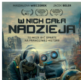
W nich cała nadzieja reż. Piotr Biedroń / Polska 2023 / 88 min

W rzeczywistości postapokaliptycznej Ewa walczy nie tylko o przetrwanie, ale zmagą się też z dotkliwą samotnością. Długotrwałe uczucie izolacji nie jest jednak jej jedynym problemem. Prawdziwy dramat zaczyna się, kiedy przez absurdalną sytuację wchodzi w konflikt ze swoim jedynym towarzyszem – Robotem.