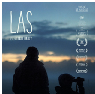
Las reż. Lidia Duda / Polska, Czechy 2024 / 84 min

POKAZ: 08.10.2024 / 20:00 Galeria Sztuki Współczesnej