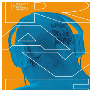
Rave reż. Łukasz Ronduda, Dawid Nickel / Polska 2024 / 79 min

POKAZ: 09.10.2024 / 19:00 Galeria Sztuki Współczesnej