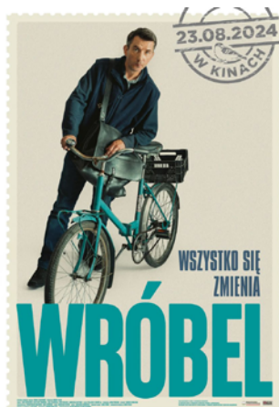
Wróbel reż. Tomasz Gąssowski / Polska 2024 / 106 min

POKAZ: 05.10.2024 / 18:00 07.10.2024 / 20:00 Kino Meduza