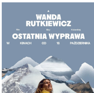
Wanda Rutkiewicz. Ostatnia wyprawa reż. Eliza Kubarska / Polska 2024 / 80 min

POKAZ: 10.10.2024 / 17:00 Miejska Biblioteka Publiczna