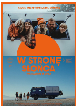
W stronę słońca reż. Agnieszka Kokowska / Polska 2024 / 92 min

POKAZ: 10.10.2024 / 20:00 Galeria Sztuki Współczesnej